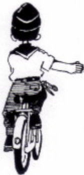
(a) Belok kanan

Terdapat beberapa isyarat tangan semasa berbasikal yang perlu dipelajari oleh ahli Pengakap. Isyarat tersebut perlu diberi dengan jelas dan betul. Ini penting supaya pengguna jalanraya yang berada di belakang dapat memahami tujuan kamu yang sebenarnya. Mereka akan berhati-hati dan mengambil tindakan yang sewajarnya untuk mengelakkan kecemasan yang boleh menyebabkan kemalangan. Ahli Pengakap boleh mempraktikkannya pula semasa menunggang basikal. Antara isyarat-isyarat tangan yang utama ialah belok kanan, belok kiri dan berhenti