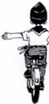
(b) Belok kiri